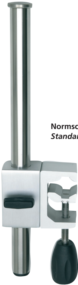
Normschienenhalter für ASTOPAD Steuergerät Standard rail bracket for ASTOPAD control unit

Halter zur sicheren Befestigung von medizinischen Geräten (z. B. ASTOPAD Steuergerät) an medizinischen Normschienen.